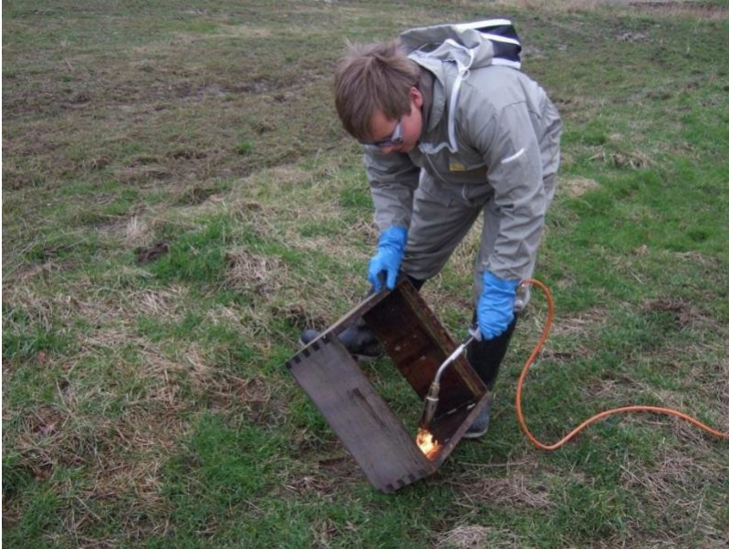
Ffig. 1: Ilosgi blwch magu â lamp losgi

Mae Ffig. 1 isod yn dangos enghraifft o losgi blwch magu â lamp losgi i ladd germau ar yr wyneb. Wrth wneud hyn, defnyddiwch flaen y 'fflam las' yng nghanol y fflam fwy a gwnewch yn siŵr bod unrhyw lud gwenyn sy'n weddill yn berwi. Hefyd, sicrhewch fod y pren yn tywyllu ac yn troi'r un lliw brown fel coffi, sy'n arwydd bod y pren wedi cael ei wresogi i dymheredd digonol ac am ddigon o amser i fod wedi'i sterileiddio'n iawn. Ni fydd angen llosgi'r pren, ond byddwch yn arbennig o drylwyr yn y corneli.