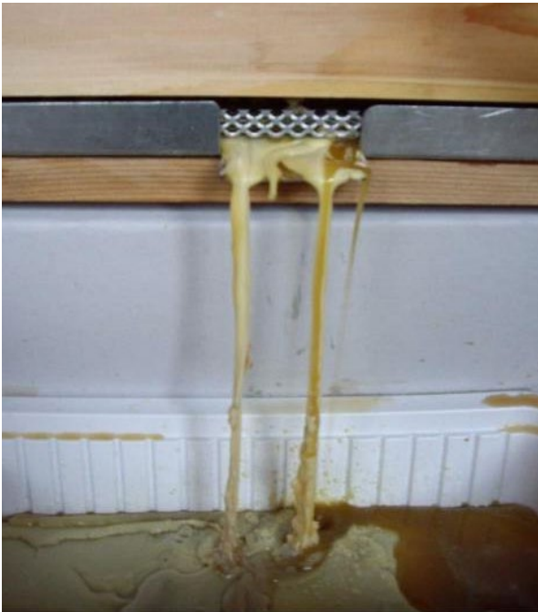
Ffig. 6: casglu cŵyr poeth o echdynnwr stêm

Dechreuwch drwy osod blwch yn llawn fframiau brwnt ar yr hambwrdd casglu pwrpasol, y bydd angen iddo fod yn debyg o ran maint a siâp i lawr cwch gwenyn, ond gydag agoriad bach ar un ymyl, a rhowch y caead arno. Rhowch un pen i biben ddyfrhau'r siambr stêm yn sownd ym mhen uchaf y blwch wedi'i selio. Wrth i'r cŵyr feddaldu ac ymdoddi, bydd yn llifo i lawr drwy'r blwch ac allan drwy'r agoriad yn yr hambwrdd, lle y gellir ei gasglu i'w roi i wasanaeth cyfnewid cŵyr (Ffig. 6). Gellir aildefnyddio'r fframiau pren wedi'u trin a'u glanhau. Dylech ganiatáu o leiaf awr i drin pob blwch o fframiau. Pan fydd y broses glanhau â stêm wedi'i chwblhau, gallwch sterileiddio'r fframiau gan ddefnyddio triniaeth soda golchi (gweler yr adran 'Glanhau gan ddefnyddio crisialau soda golchi' yn y daflen hon), cyn gosod sylfaen newydd.