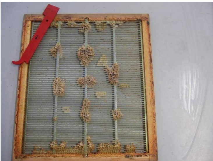
Ffig. 7: dylid tynnu crwybrau a gweddillion, a glanhau'r offeryn cwch gwenyn ar ôl ei ddefnyddio

Bydd angen glanhau a sterileiddio atalyddion brenhines mewn gwahanol ffyrdd, yn dibynnu ar y math a ddefnyddir. Dechreuwch drwy gael gwared ar weddillion drwy grafu ag offeryn addas (Ffig. 7). Mae'n haws cael gwared ar lud gwenyn mewn tywydd oer a gaeafol, gan y bydd glud gwenyn yn frau dan yr amodau hyn. Mae brwsh gwifrau yn ddefnyddiol iawn i gael gwared ar ddarnau o gŵyr a glud gwenyn. Wedyn, gellir llosgi atalyddion gan ddefnyddio lamp losgi ond, os ydynt wedi'u sodro, gofalu rhag ymdoddi'r sodradau gan y byddant yn aml yn 'feddal' iawn. Os oes clefyd y gwenyn wedi bod yn bresennol, rhaid dinistrio atalyddion â rhychau sinc drwy eu llosgi. Fel arall, gellir sgrwbio'r rhain yn lân â hydoddiant soda golchi. Bydd angen i'r hydoddiant fod yn grynodeg (1 cilogram o soda i 4.5 litr o ddŵr), a bydd ychwanegu diferyn o hylif golchi llestri at y cymysgedd yn helpu hefyd. Bydd angen i chi wisgo dillad diogelu addas, diogelu eich llygaid a defnyddio menig rwber. Gellir diheintio atalyddion plastig yn yr un modd â chychod gwenyn plastig a'u rhannu, fel y disgrifir uchod.