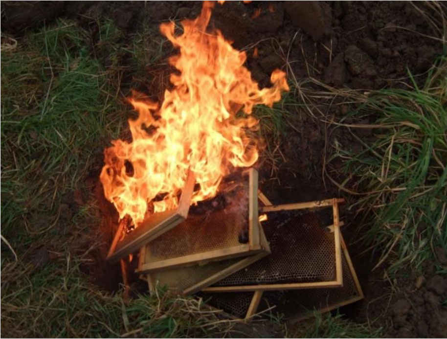
Ffig. 8: Ilosgi fframiau sydd wedi'u heintio â chlefyd y gwenyn