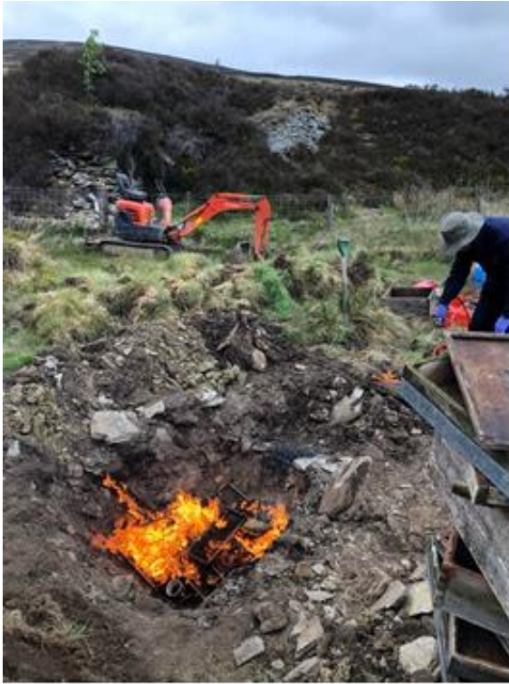
Delio ag AFB yn Sir Benfro