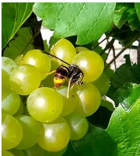
Cacynen Asia yn bwyta grawnwin

Bu lleihad eleni yn nifer cacwn coesfelen Asia a welwyd yn y DU, gyda dim ond un nyth Cacwn Asia wedi'i darganfod a'i dinistrio gan arolygwyr UWG mewn afallen yn Gosport, Hampshire ddydd Gwener 11 Medi. Digwyddodd hyn o ganlyniad i adroddiadau gan ddau unigolyn yn yr ardal, yr oedd un ohonynt yn cadw gwenyn a oedd wedi gweld Cacwn Asia yn bwyta ei rawnwin. Nyth fach ydoedd, tua 20cm o ddiometr. Cafodd gwenynwyr lleol wybod amdani gan y Timau Cacwn Asia ac mae gwaith monitro yn parhau yn yr ardal.