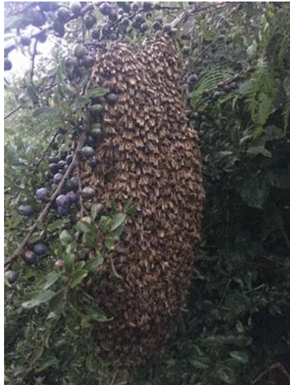
Haid hwyr gydag eirin hirion!