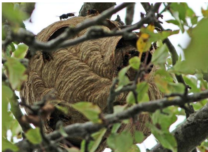
Y nyth mewn afallen yn Gosport

Mae gan yr UWG gysylltiadau agos â Chydgyssylltydd Cacynen Asia Llywodraeth Ynys Jersey a thîm o wirfoddolwyr, oherwydd eu lleoliad rhyngom â Ffrainc. Mae arolygwyr yr UWG wedi cynnal ymweliadau maes yno yn y gorffennol er mwyn dysgu o'u profiad. Ni fu cymaint o nythod Cacwn Asia ar Ynys Jersey eleni ychwaith, gyda 38 o nythod wedi'u dinistrio erbyn 15 Hydref, o gymharu â'r 83 a ganfuwyd erbyn diwedd 2019. Bydd y lleihad o ganlyniad rhannol i'r gwaith parhaus i ddifa nythod a mamwenyn sy'n eu sefydlu dros y blynyddoedd diwethaf. Rhesymau tebygol eraill a nodir yw lleithder a thymereddau amrywiol rhwng mis Ionawr a mis Mawrth eleni, a olygodd fod y mamwenyn a oedd yn