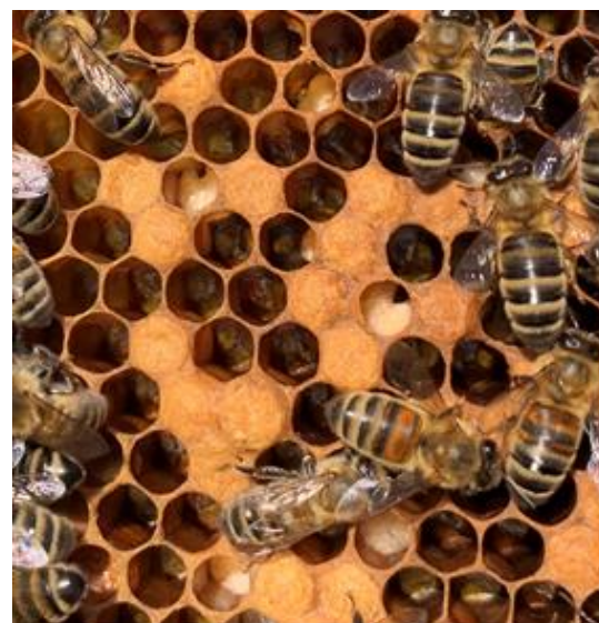
Larfâu yn gwingo gyda Chlefyd Ewropeaidd y Gwenyn Llundain Ben Bowen