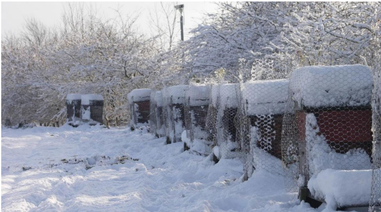
Ffig 3. Caiff rwyd weiren ei rhoi o amgylch y cwch gwenyn er mwyn ei ddiogelu rhag cnocellau.

Dylech osod gardiau llygod er mwyn cadw cnofilod bach allan, gan eu bod yn aml yn nythu mewn cychod gwenyn yn y gwanwyn. Mewn rhai ardaloedd, gall cnocellau gwyrddion ddifrodi cychod gwenyn, felly, os yw hyn yn broblem hysbys yn eich gwenynfa neu yn y cyffiniau, dylech roi cawell syml wedi'i gwneud o rwyd weiren dros ac o amgylch y cwch gwenyn, o leiaf 300mm i ffwrdd o waliau'r cwch er mwyn atal difrod gan roi lle i'r gwenyn hedfan.