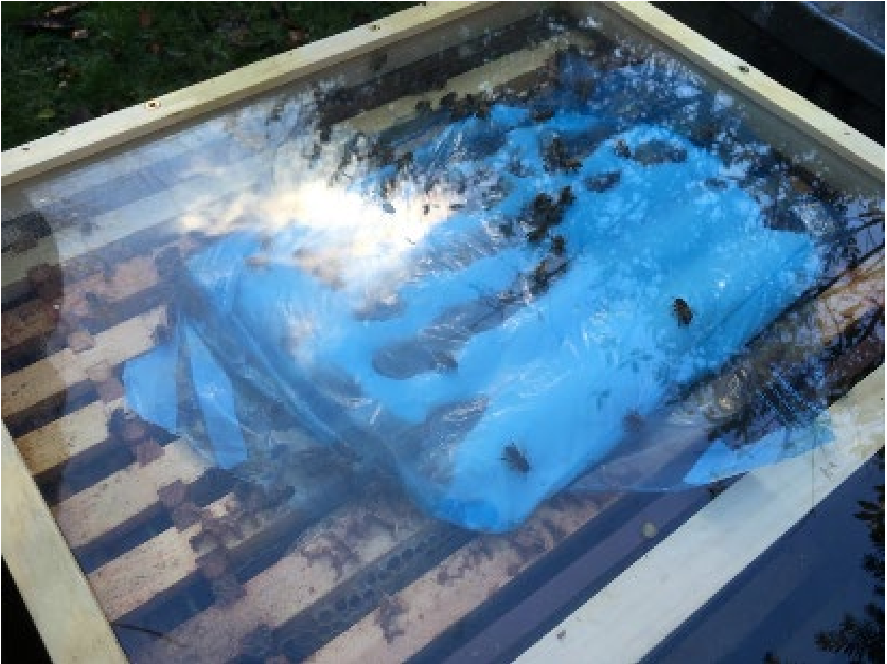
Ffig 4: Y defnydd o fwrdd gorchudd tryloyw i gadw golwg ar y nythfa yn y gaeaf.

Pan fyddwch yn agor y cwch gwenyn, dim ond asesu'r clwstwr yn gyflym o ran storffeydd bwyd y byddwch yn ei wneud. A oes ganddynt ddigon o fwyd? Os felly, a yw y tu hwnt i'w cyrraedd? Dim ond tua 20 eiliad y dylai'r archwiliad hwn ei gymryd – peidiwch â loetran. Mae'n well bwrw golwg sydyn ar y storffeydd, hyd yn oed mewn tywydd oer, na darganfod nythfa sydd wedi marw o newyn yn y gwanwyn. Mae defnyddio 'cwiltiau gwydr' neu fyrddau gorchudd polycarbonad yn hytrach na rhai pren haenog yn helpu archwilio'r nythfa heb adael yr holl wres allan.